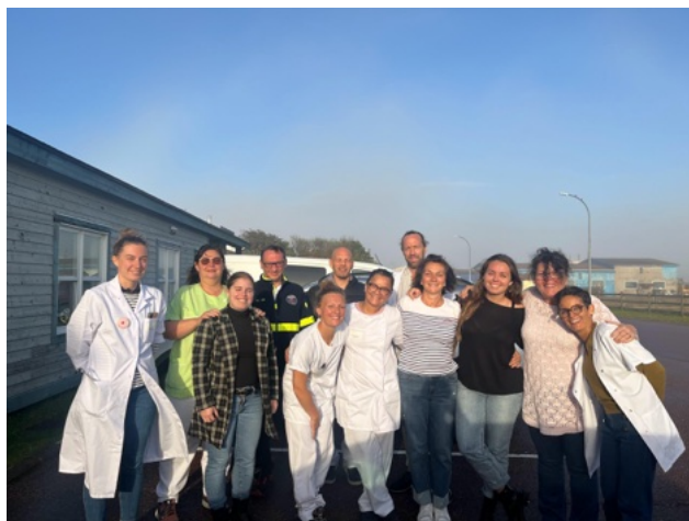
Et voilà toute l'équipe de Miquelon.