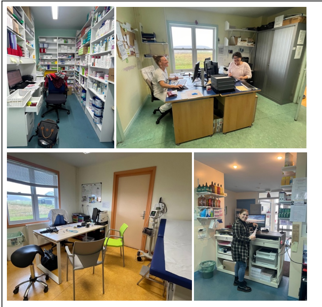
Voici quelques photos de mes collègues du centre médical de Miquelon, secrétaire, préparatrice en pharmacie et IDE. En plus, une photo de la mini pharmacie de Miquelon et du cabinet de consultation du médecin.